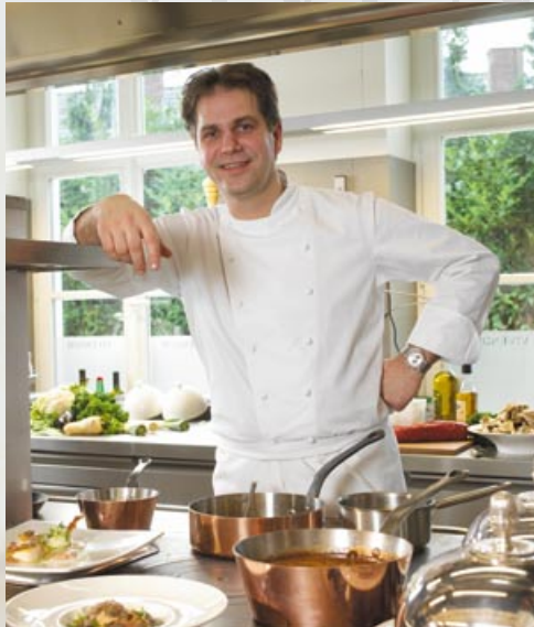
Passie voor koken