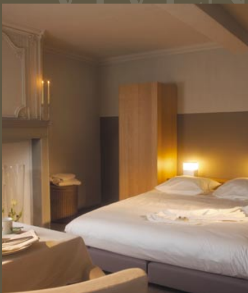
Comfort en klasse