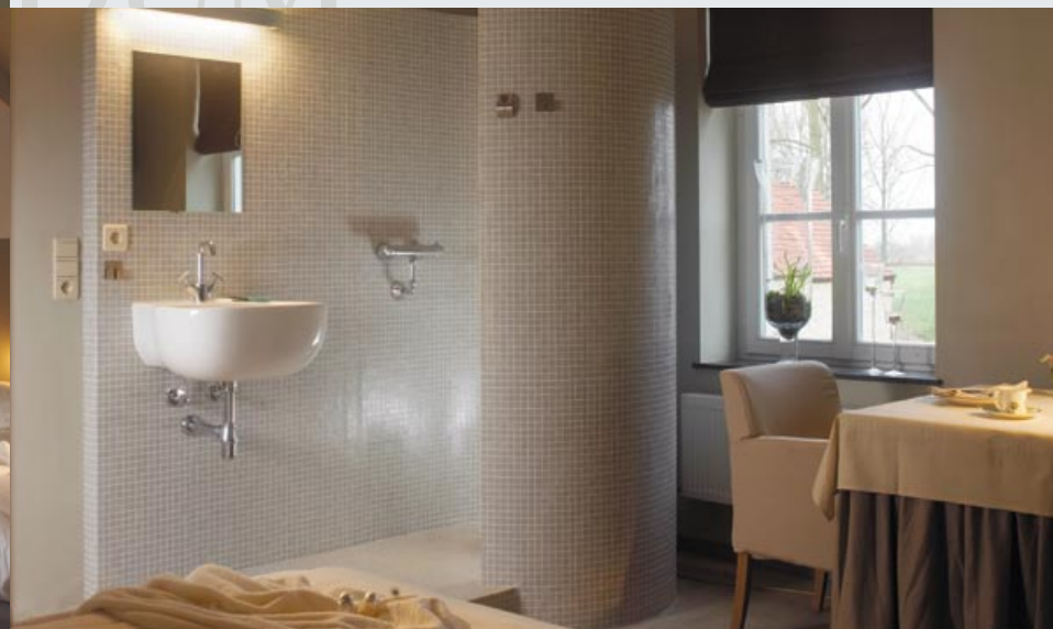
De rust van het Maasland

De suite is uitermate geschikt voor gasten die prijs stellen op extra comfort. Ook voor een langer verblijf is de suite van Vivendum een aanrader. Bovendien heeft de suite een luxueuze badkamer.