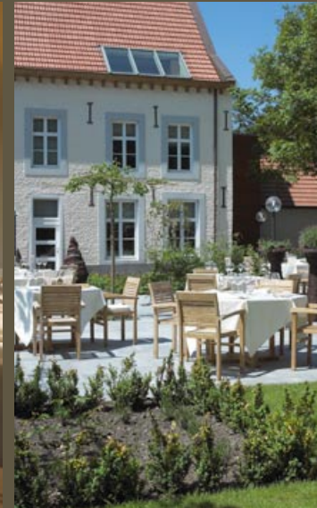
Genieten in de terrastuin

Fijnproevers kunnen hun hart ophalen bij de gastronomische kunststukjes van chef-kok Alex Clevers. De kookstijl van deze 'Jeune Restaurateur d'Europe' is vernieuwend met een klassieke basis. Zijn culinaire creaties getuigen van inventiviteit en passie binnen hedendaagse normen.